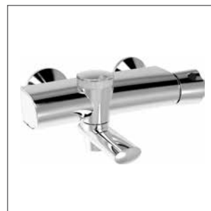
Miscelatore termostatico vasca