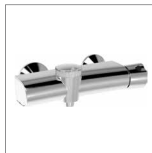
Miscelatore termostatico doccia